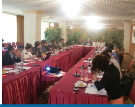
ՄԱԿ ԱՄ 1325 բանաձևի քաղաքացիական հասարակության 2013 թ - ի մշտադիտարկման զեկույցի ներկայացում

ՀՀ ԳԱԾ - ի ստեղծմանը՝ մշտադիտարկման զեկույցների ստեղծման և դրա հետագա ջատագովության միջոցով: Հատկանշական է, որ զեկույցներն անդրադարձ են կատարում ոչ միայն ՀՀ - ում, այլև Արցախում/Լեռնային Ղարաբաղում բնակվող կանանց իրավիճակին: Մի շարք կազմակերպություններ «Կանայք, խաղաղություն և անվտանգություն» օրակարգը ներառել են իրենց աշխատանքային օրակարգի մեջ՝ որպես գործունեության հիմնական ուղղություններից մեկը: