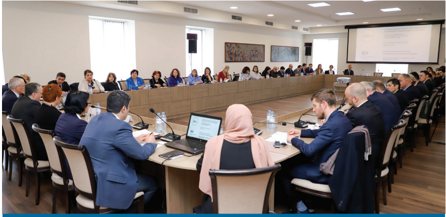
«Կանայք, խաղաղություն և անվտանգություն. միջազգային և հայաստանյան փորձը», մարտի 15, 2019

Նպատակով 2019 թ - ի մարտի 15 - ին Արտաքին գործերի նախարարությունում կայացավ «Կանայք, խաղաղություն և անվտանգություն. միջազգային և հայաստանյան փորձը» քննարկումը, որի պաշտոնական բացումը կատարեց ԶԶ ԱԳ նախարար Զոհրաբ Մնացականյանը: 16 Հանդիպման պատվավոր հյուրերն էին ՆԱՏՕ - ի Կանանց, խաղաղության և անվտանգության հարցերով