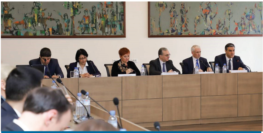
«Կանայք, խաղաղություն և անվտանգություն. միջազգային և հայաստանյան փորձը», մարտի 15, 2019

ՄԱԿ ԱԽ 1325 բանաձևի ՀՀ ԳԱԾ - ի ստեղծումը և իրականացումը ներկայացնում են այնպիսի գործընթաց, որն ուղղված է ոչ միայն իրավական մեխանիզմների ստեղծմանը, այլև թիրախային տարբեր նախաձեռնությունների և հանրային միջոցառումների իրականացմանը: ԳԱԾ - ի ընդունումից ի վեր Հայաստանում պետական և ոչ պետական հաստատությունների կողմից կատարվել են մի շարք միջոցառումներ, որոնցից որոշները հատկանշական են: