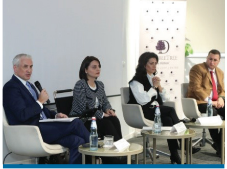
«Կանանց դերը խաղաղության հաստատման հարցում. հնարավորություններ և մարտահրավերներ», դեկտեմբերի 4, 2019 թ.

ՄԱԿ ԱԽ 1325 բանաձևը կոչ է անում կանանց հավասար մասնակցության ապահովում որոշումների կայացման, բանակցային, հակամարտությունների կառավարման և հաղթահարման գործընթացներում, ինչպես նաև անվտանգության և պաշտպանության ապահովման և խաղաղապահական առաքելություններում: