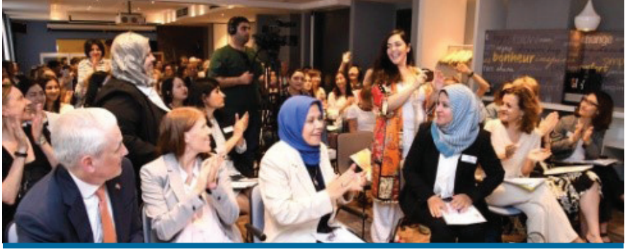
«Կանայք բանակցային սեղանի շուրջ՝ առավել արդար մոտեցում բոլորի համար» համաժողով, «Դեմոկրատիան այսօր» ԴԿ, հունիս, 2019 թ.

առավել խոցելի խմբերին և օգնում է բարձրացնել վերջիններիս քաղաքացիական պաշտպանվածության մակարդակը, սոցիալական - տնտեսական իրավունքների ապահովումը: